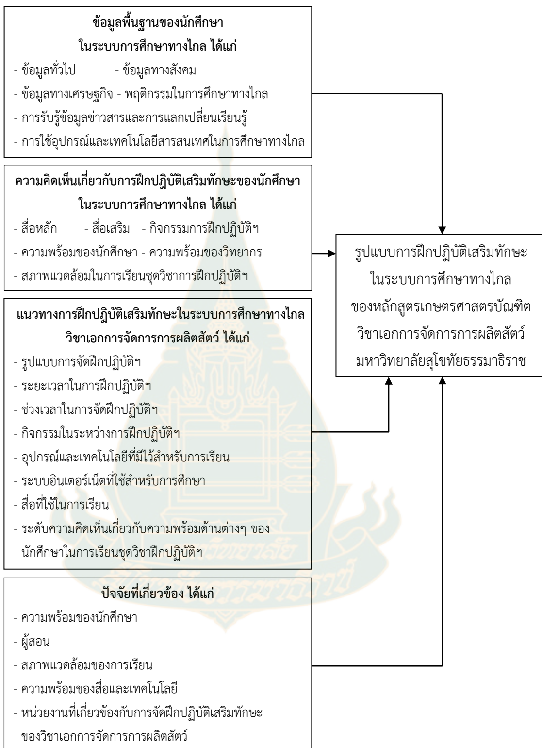
ภาพที่ 1 กรอบแนวคิดการวิจัย